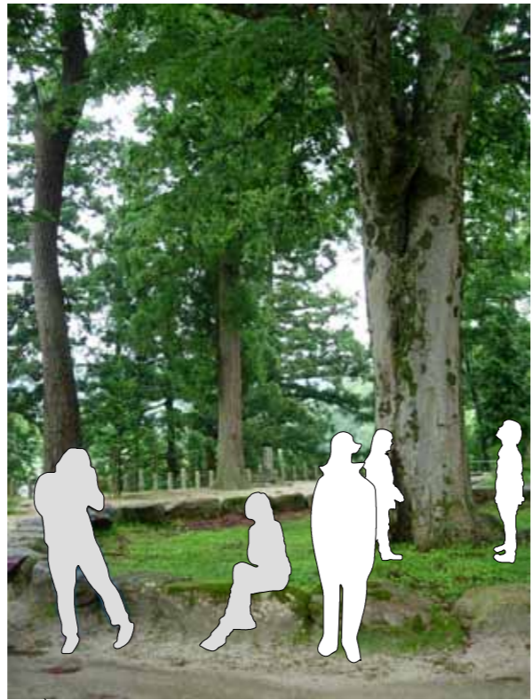
お寺の境内にある大きな木下に集まる人々