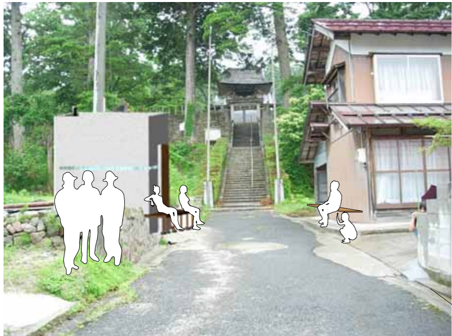
向かい合った住居とhutの住人がつづく