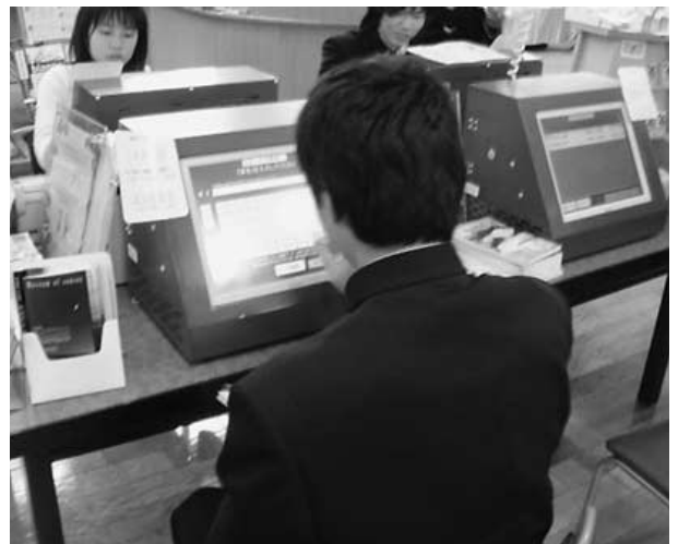
コンピュータで本を検索しています。

抱負として、今年最後の図書委員なので最大限の努力を尽くして、みなさんによりよい環境で図書館を利用できるようにしていきたいです。