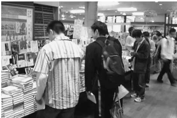
本を探す図書委員