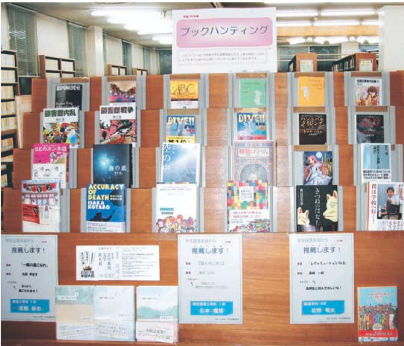
ブックハンティングによる新着図書