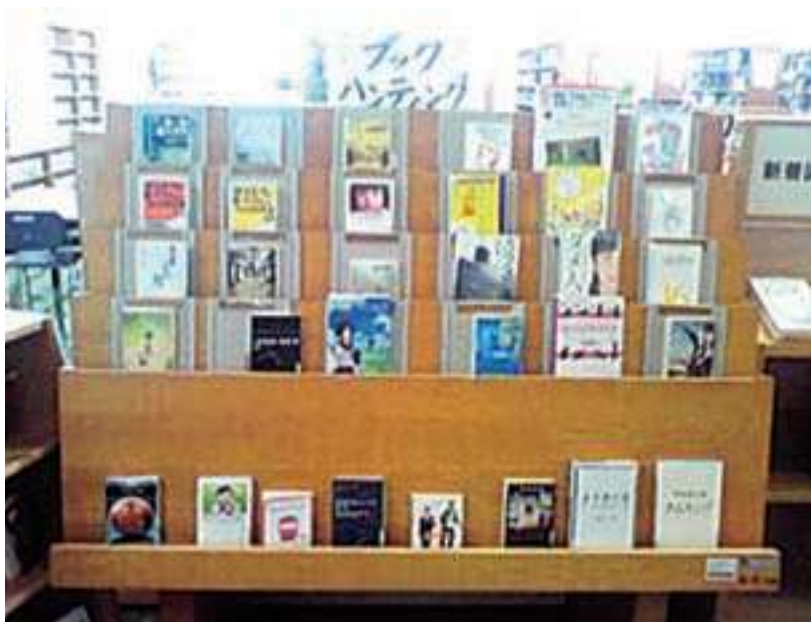
ブックハンティングによる新着図書コーナー