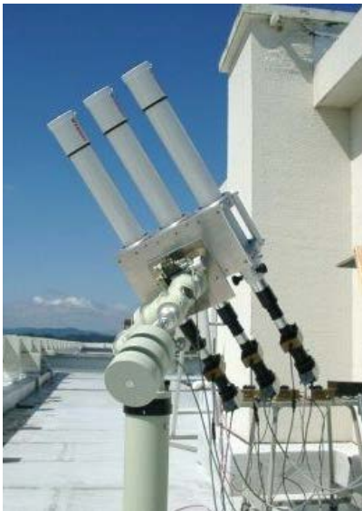
図 1 太陽彩層速度場観測望遠鏡

スーパーコンピューターを利用した数値シミュレーションにより、太陽光球における磁気リコネクションの時間発展を追跡し、それによって生じる電磁流体波のエネルギーはどの程度か、またその電磁流体波によって「スピキュール」などのジェット現象が説明できるか研究しています。