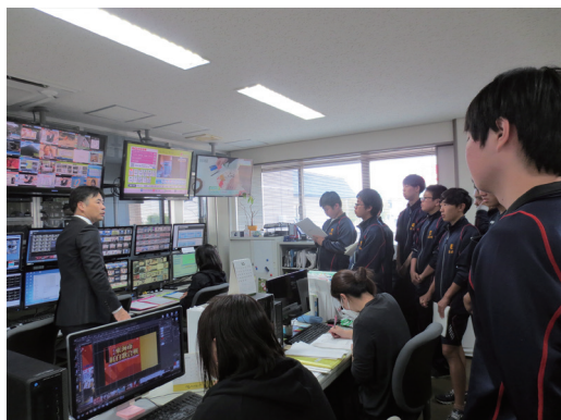
校外見学旅行(オープンファクトリー) (2年生クラス行事にて地元企業見学を実施)