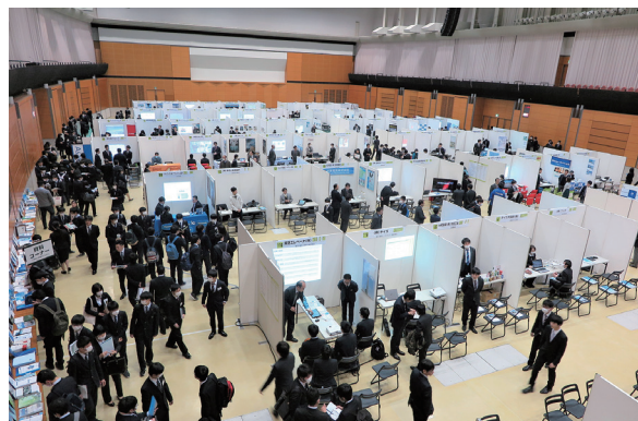
米子高専生のための進路研究セミナー (全国最大規模となる268ブースにて実施)