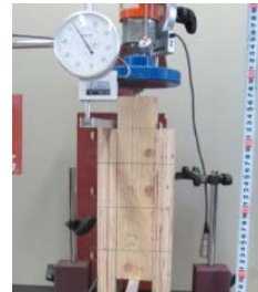
図3 地場産材接合部の実験