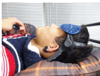
図 1 簡易脳波計を用いた睡眠実験の様子

将来展望として、長期的な実験に基づき可能な限りの被験者数の増加や、個人の数か月間にわたる観測により、個人差の問題や精度面の問題解決を図る予定である。